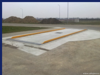
Silniční mostové váhy