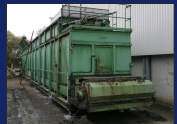
Váhy pro síla